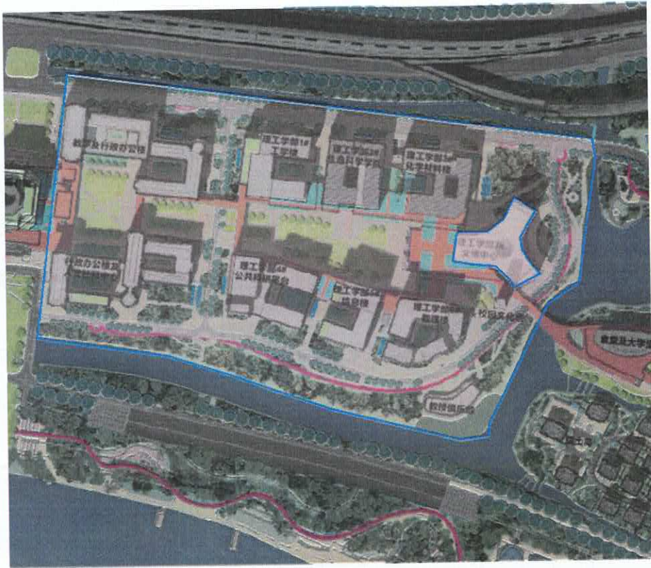
光电玻璃位置示意图